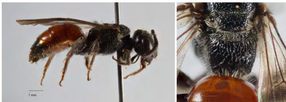
Fig. 3. Hun af blodbien Sphecodes rufiventris (Panzer, 1798), Arnager (B), 15.V.2015, Hans Thomsen Schmidt leg. Venstre: Habitus. Højre: Bemærk de fremtrædende tværstriber på siderne af propodeum.

Bestemmelse: Med den illustrerede nøgle i Amiet et al. (1999) nøgles ved begge køn uproblematisk frem til arten. Hunner måler 6-9 mm, har bagvinger med flere end 8 vingekroge langs forranden og med svagt buet cubital-ribbe. Hovedets bagkant er afrundet (uden skarp kant, set ovenfra) og hovedformen er oval (bredere end højt, set forfra). Mesonoten er spredt punkteret. Et markant nøglepunkt er de for arten karakteristiske glinsende og vinklede, regelmæssigt længdestribede mesopleurer (forkroppens sider). Bemærk også de fremtrædende tværstriber på siderne af propodeum (fig. 3).