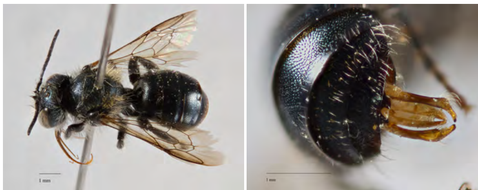
Fig. 2. Han af murerbien Osmia parietina Curtis, 1828, Rinkenæs Skov (SJ), 24.V.2015, Hans Thomsen Schmidt leg. Venstre: Habitus. Højre: Genitalie.

Hunner måler 8-9 mm og er med Amiet et al. (2004) forholdsvis nemme at bestemme. Til test af nøglen har forfatterne kun haft et par ældre, let blegnede, udenlandske (spanske) eksemplarer til rådighed. Der er to veje i nøglen, afhængig af om eksemplarets krop fremstår med eller uden metalglans. Behåringen er på friske eksemplarer overvejende rødbrun, sort på T3-5. Scopa på bagkrops underside (bugbørster) er helt sort. Det hjerteformede felt er mat. Ved tvivl om dette (kan fremstå relativt blankt) vil nøglens følgende karakterer hurtigt gøre det tydeligt at man er gået galt. T1-3 er glinsende med punktur på fladen, men bagrande er punktløse og på T2-3 med svag chagrinerung.