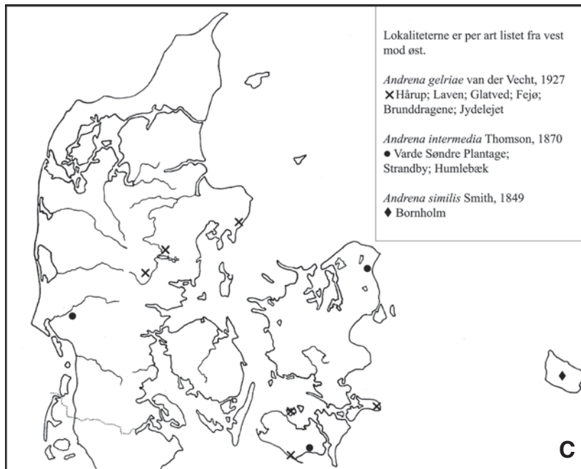
Fig. 4 a,b,c Lokalteter for de her publicerede fund af nye arter for Danmarks bi-fauna. Localities for bee species recorded as new to the Danish bee fauna.