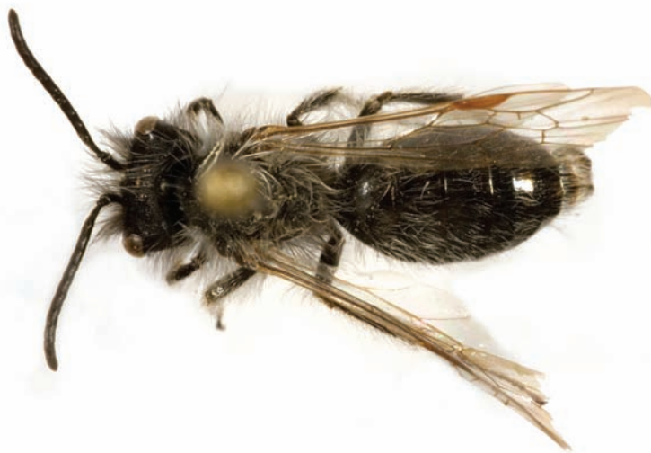
Fig. 5 Han af Andrena nycthemera Imhoff, 1868, Dynt Mark (Sønderjylland), 07.IV.2007, Hans Thomsen Schmidt leg. Male Andrena nycthemera Imhoff, 1868, locality Dynt Mark (Sønderjylland), 07.IV.2007, Hans Thomsen Schmidt leg.

Den er ikke kendt fra Schleswig-Holstein (Smissen, 2001), men er angivet med nyere fund fra Mecklenburg-Vorpommern (Kornmilch, 2008).