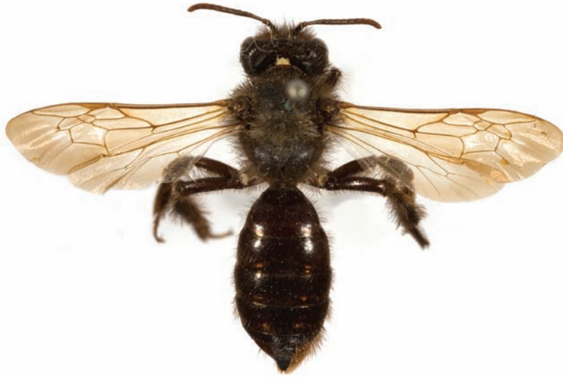
Fig. 3 Hun af Andrena nasuta Giraud, 1863, Møn, ældre eksemplar uden datoangivelse.

Female Andrena nasuta Giraud, 1863, locality Møn, old specimen with no date.