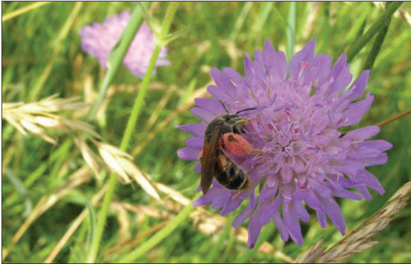
Fig. 2 Blåhat-jordbien ( Andrena hattorfiana (Fabricius, 1775)) på blåhat ( Knautia arvensis ) ved Hverrestrup Bakker (Himmerland). Foto: Henning Bang Madsen, 14.VII.2005. Scabious mining bee (Andrena hattorfiana (Fabricius, 1775)) on field scabious (Knautia arvensis) at locality Hverrestrup Bakker (Himmerland). Photo: Henning Bang Madsen, 14.VII.2005.

er udprægede forårsdyr, hvoraf flere er oligolektiske på pil ( Salix ), som ellers primært er vindbestøvet (Fig. 1).