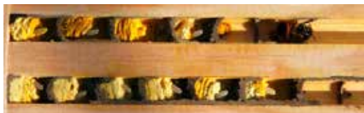
Fig. 7. Et kig ind i et bihotel. Den røde murerbi har bygget cellerne af mudder. Øverst til højre sidder en rød murerbi hun, som er på størrelse med en honningbi. I dette bihotel er gangene fræset helt igennem, og lukket med en plade i den ene ende.

4. Gangene i bihotellet skal være 4-10 mm i diameter. Der kan være gange med forskellige diametre i det samme bihotel, så man kan tiltrække forskellige slags bier. Lucernebladskærerbi foretrækker f.eks. gange med en diameter på omkring 6 mm, mens den røde murerbi foretrækker omkring 8 mm.