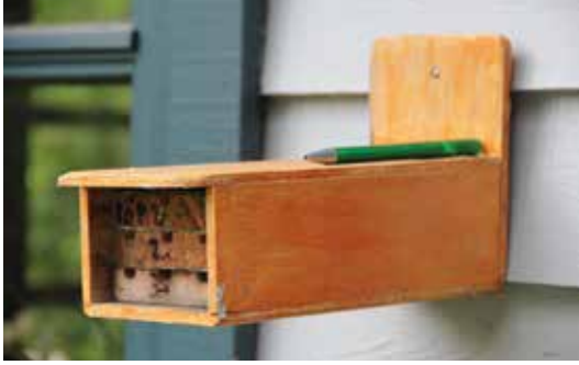
Fig. 6. Dette insekthotel har hængt en meter fra en hoveddør i mange år, men der er aldrig nogen, der er blevet generet af bierne. Bemærk de små søm forrest på hver plade, som bruges til at tage de plastdækkede plader ud med.

4. Gangene i bihotellet skal være 4-10 mm i diameter. Der kan være gange med forskellige diametre i det samme bihotel, så man kan tiltrække forskellige slags bier. Lucernebladskærerbi foretrækker f.eks. gange med en diameter på omkring 6 mm, mens den røde murerbi foretrækker omkring 8 mm.