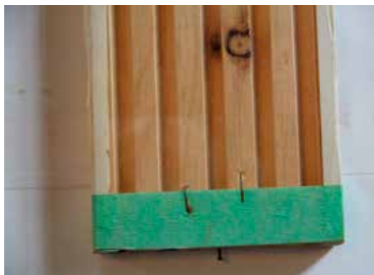
Fig. 5. En plade dækket med tykt plast. Plasten er sat fast med malertape, og der er et lille søm forrest på pladen.