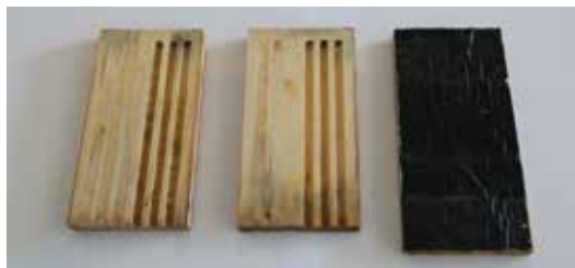
Fig. 1. Et bihotel laves af en bund (til venstre), nogle mellemlader (i midten) og en top (til højre).

Mange af os har stor fornøjelse af at sætte fuglekasser op og følge med i fuglenes liv. Man kan også sætte redekasser op til de vilde bier, og her har man muligheden for at komme helt tæt på dem samtidig med, at man hjælper dem med en bolig.