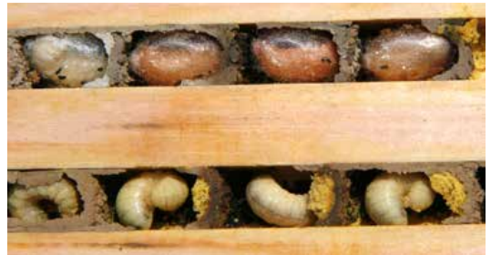
Fig. 8 Endnu et kig ind i et bihotel. Det er meget fascinerende ikke mindst fordi man kan se bier i øverste venstre hjørne spinde sin kokon.

Ved samlingen af bihotellet lægges bunden nedest med de fræsede gange opad. Herpå lægges mellemladerne, og taget lægges øverst. Bihotellet holdes samme med strips, der trækkes hårdt sammen, så der ikke kommer lys ind ad sprækkerne mellem pladerne. Det er en fordel inden da at dække taget med mørk gaffatape, for at gøre det mere modstandsdygtigt overfor regn (fig. 4).