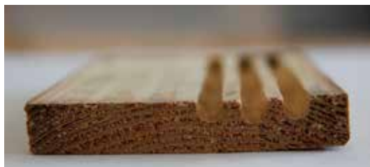
Fig. 2. I bunden fræses der kun gange i den ene side.