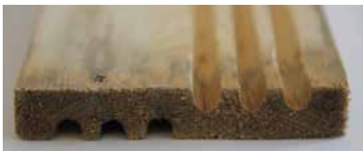
Fig. 3. I mellemladerne fræses der gange i begge sider.

Størstedelen af de enlige bier bor i jorden, men en del bor over jorden i gange de selv laver eller i færdiglavede gange i f.eks. hule plantestængler. Bierne kommer frem fra redestederne om foråret, parrer sig, og derefter finder hunnen et egnet redested, hvor hun kan lægge sine æg. Inderst i reden lægger hun befrugtede æg, der udvikler sig til hunner og yderst ubefrugtede æg, der bliver til hanner. Efter 5-8 uger dør hun, og først næste år kommer hendes afkom frem.